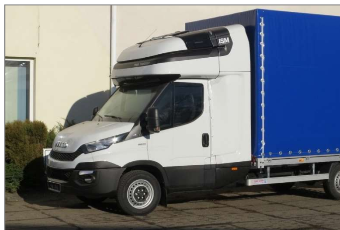
Space Master II SS

* Dla kabiny Adapt SN i Space Master II SN całkowita wysokość pojazdu nie przekracza 3m